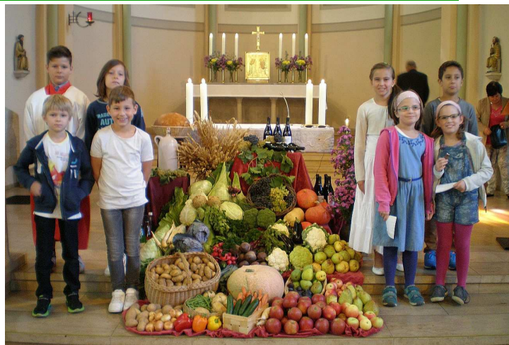
Beim Erntedankgottesdienst der St. Johannesgemeinde am 25. September haben Schülerinnen und Schüler der Luginslandschule mitgewirkt.