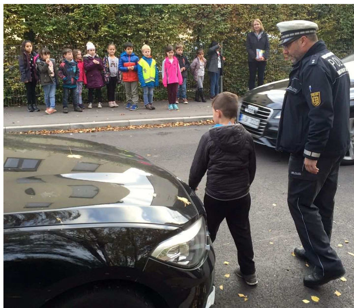
Die Verkehrssicherheit unserer Schülerinnen und Schüler liegt uns sehr am Herzen. Das Bild zeigt die Klasse 1c beim praktischen Üben der Straßenquerung. Alle Kinder werden in die Lage versetzt selbstständig und sicher den Weg zu Fuß zur Schule zu bewältigen!